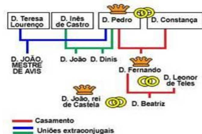
Figura 1 – Morte de D. Fernando e problema da sucessão ao trono.

A escolha recaiu em D. João Mestre da Ordem Militar de Avis , filho bastardo de D. Pedro I e meio-irmão de D. Fernando, portanto um legítimo pretendente ao trono (Figura 1).